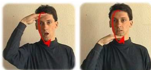
[Vat- Vater ter]