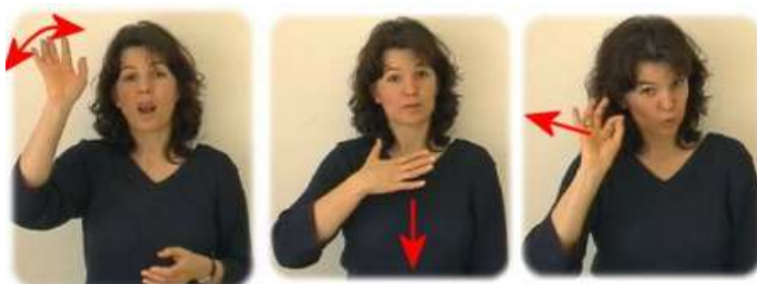
Hallo! Geht es dir gut?

W eißt du was? Am besten schaust du dir die Bilder an und probierst es selbst einmal aus.