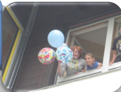
Der spannende Augenblick.

Erfahrungen: Es ist nicht unmöglich, diese Aufgabe zu lösen. Sie wird jedoch zu einfach, wenn die Fallstrecke nicht ausreichend lang ist, 7m sind absolutes Minimum. Schön wäre zudem eine betonierte oder möglichst harte „Aufprallfläche“. Man kann auch mehrere Gruppen „gegeneinander“ arbeiten lassen (dann ist es aber kein Kooperationspiel).