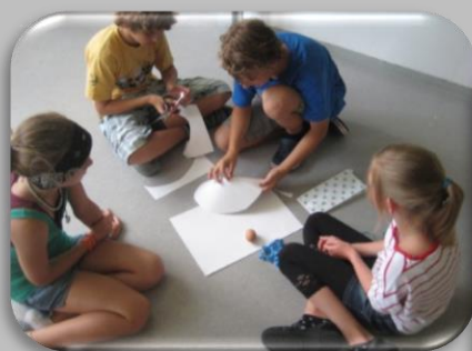
20 Minuten Vorbereitungszeit.