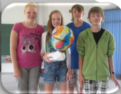
Die Flugobjekte werden vorgestellt.