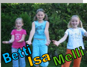
Hände nach vorne öffnen.