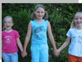
Sich die Hände reichen.