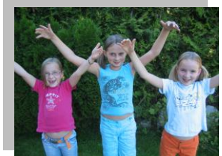
Einen Sonnenkreis ziehen.